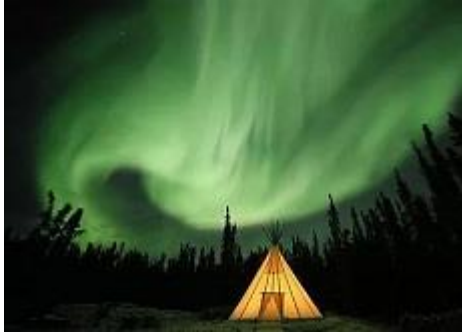
梦幻小木屋&原住民帐篷观赏极光