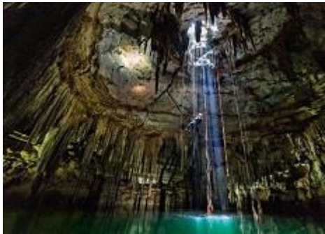
网红打卡“一线天天坑”