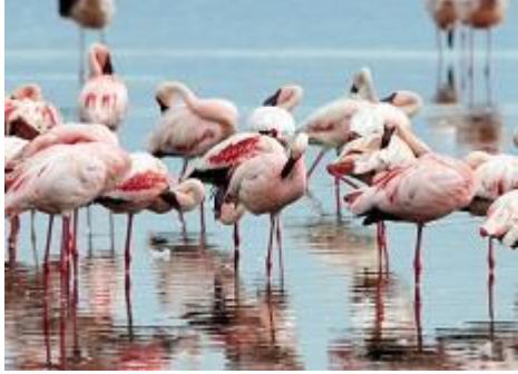
红树林火烈鸟自然保护区