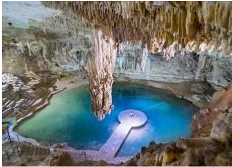
百年国王庄园天坑