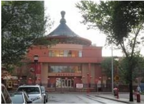
卡爾加里中華文化中心

約下午 2 點 15 分於卡爾加里機場內陸航班 8 號行李帶（詢問中心）或 2 點 45 分於卡爾加里中華文化中心門口（面向 1 街）集合。向落基山脈出發，前往班夫小鎮。充裕時間自由漫步於熱鬧非凡的班夫大道。更可自費參加 2 小時野外探索之旅（需預訂），邂逅麋鹿、駝鹿、棕熊等野生動物。