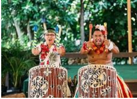
波里尼西亚文化中心